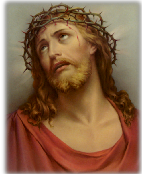
PASIÓN DE JESÚS, Nº 2

Madre mía, Virgen Santísima, ruega por mí.