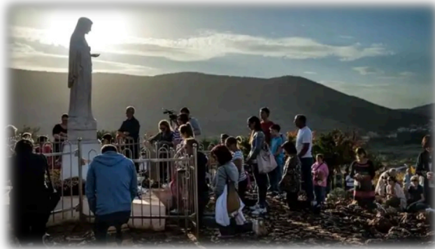
Estatua de la Virgen colocada en la colina de las apariciones (Podbrdo), en el lugar donde se apareció.

2.- Los frutos: En estos ya más de cuarenta años de apariciones los frutos son innegables. Ha habido milagros y curaciones extraordinarias, documentadas por informes médicos que las consideran inexplicables. Ha habido infinidad de conversiones: personas ateas, rabiosas contra la Iglesia, se han encontrado con el Dios que creían no existía. Personas que habían perdido la fe han reencontrado el valor de la misma. Muchísimos pecadores encuentran el perdón de Dios en Medjugorje. Es muy significativo la cantidad de confesiones que hay allí. Con razón algunos lo han llamado “el confesonario del mundo”. Muchos jóvenes acuden al lugar y reavivan su fe apagada o perdida. Otros han sentido allí la llamada al sacerdocio o a la vida consagrada. Y esto viene ocurriendo, de forma continua, durante cuarenta años. Si Medjugorje fuera cosa del