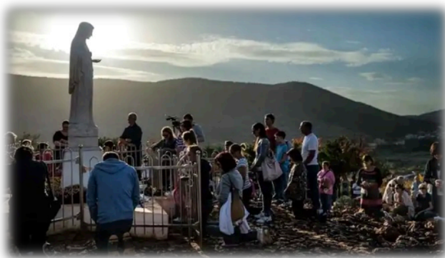
Estatua de la Virgen colocada en la colina de las apariciones (Podbrdo), en el lugar donde se apareció.

Aquella tarde la noticia se divulgó por todo el pueblo: algo sobrenatural estaba pasando. La gente empezó a querer saber más del asunto.