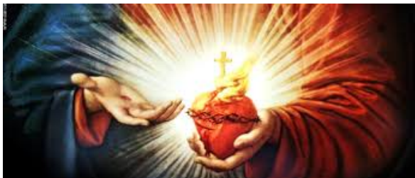
Tercera gran aparición: Jesús pide reparación

había hecho formar el designio de manifestar su Corazón a los hombres con todos los tesoros de amor, de misericordia, de gracia, de santificación y de salvación que contiene. A todos aquellos que quisieran tributarle y procurarle todo el amor, honor y gloria que esté en su poder, los enriquecerá con abundancia y profusión con esos divinos tesoros del Corazón de Dios, que es la fuente de ellos. Pero es preciso honrarle bajo la figura de ese Corazón de carne, cuya imagen quería que se expusiera y que llevara yo sobre mi corazón, para grabar en él su amor, llenarlo de todos los dones de que Él estaba lleno y destruir todos sus movimientos desarreglados. Y dondequiera que esta imagen fuere expuesta para ser honrada, derramaría sus gracias y bendiciones. Esta devoción era como un supremo esfuerzo de su amor que quería favorecer a los hombres para sacarlos del imperio de Satán y colocarlos bajo la dulce libertad del imperio de su amor, el cual quería restablecer en los corazones de todos los que quisieran abrazar esta devoción”.