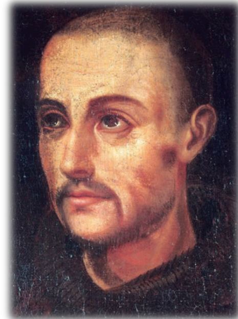
Verdadero retrato de San Juan de Dios

Juan de Dios no escribió ningún libro con enseñanzas espirituales. Su vida y sus hechos son su enseñanza. Desde su conversión se dedicó plenamente al amor de Dios y al amor del prójimo, concentrado en el servicio a los pobres y en