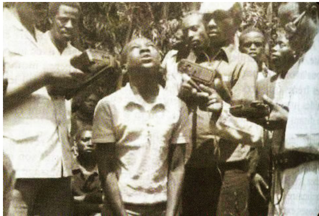
Segatashya durante una aparición

-El objetivo principal de mi vida es hacer llegar los mensajes de Jesús a todo el mundo; lo demás es secundario. El Señor debe ser siempre lo primero.