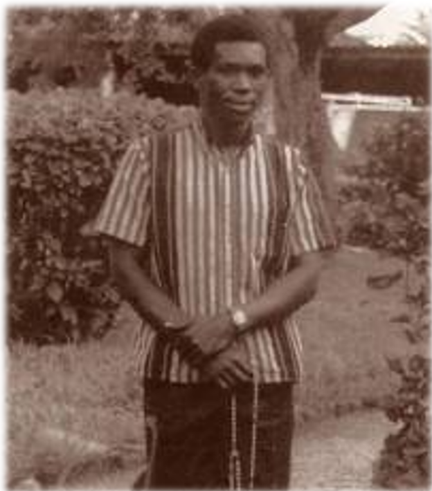
Segatashya con un Rosario

En esta ocasión Segatashya no tuvo ningún problema para entrar en el país. Cuando habló con el obispo éste le dio la bendición para que predicarían en la región, pero después no le permitió hablar en las iglesias. Así que Segatashya se quedaba en la calle y predicaba allí.